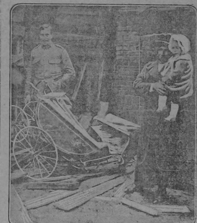
BABY ESCAPES SHELL, BUT CARRIAGE WRECKED

Women and children in the war zone child out, but, oddly, it was not so in France have had narrow escapes riotously hurt. The mother was stunned from death during artillery duels, but by the shock, but recovered in a few moments and ran frantically out, that pictured here. The baby was expected to see her baby dead. The leap in the baby carriage and her mother British soldier in the picture allowed there was in the house when a German the photographer to snap the mother shell hit the building. The shock wrecked and baby and the wreckage a few killed the baby carriage and threw the hours later.